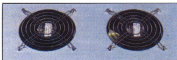
Vista ventilatori - pianta superiore View ventilator - top part Ventilatorsicht - Oberteil