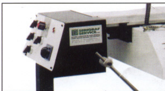
Comandi con temporizzatore e fotocellula Operate with measure time device and photocell Bedienung mit Zeitmesser und Fotozelle